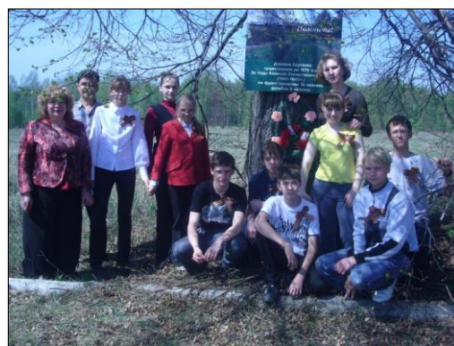
Памятный знак, установленный уч-ся гимназии №14