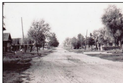
Одна из улиц посёлка

Велетьма существовало 113 дворов, в которых проживало 319 мужчин и 319 женщин. Согласно алфавитному списку населенных пунктов Нижегородской губернии 1925 года (составлен по результатам обследования волостей в августе-октябре 1924 года) в поселке Верхняя Велетьма проживало 220 человек. В настоящее время деревня является нежилой.