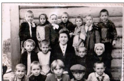
Дети п. Каменный Шолох с учительницей