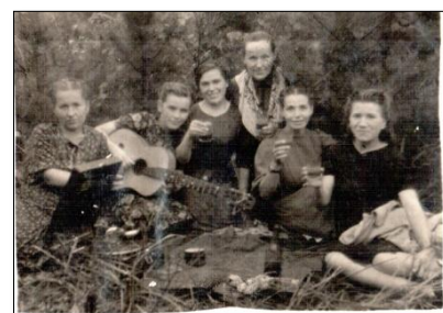
Около 1942-44 гг.