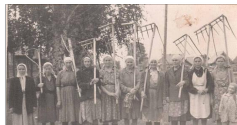
Колхозницы колхоза им. Второго краевого съезда Советов