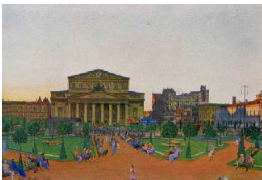
Площадь Свердлова (бывшая Театральная)