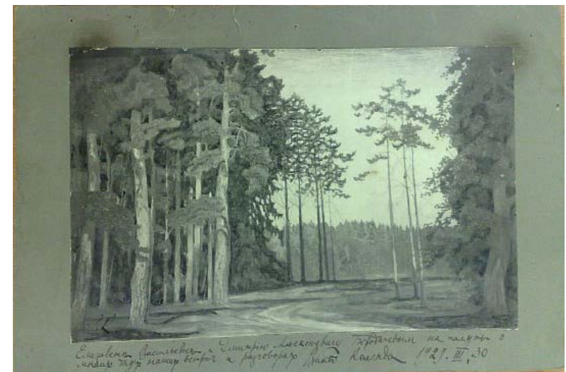
Рисунок с автографом художника