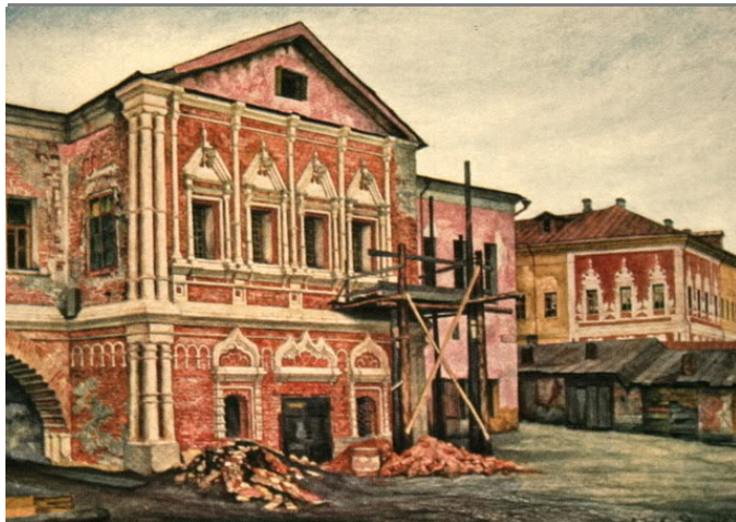
Палаты В.В. Голицына в Охотном ряду