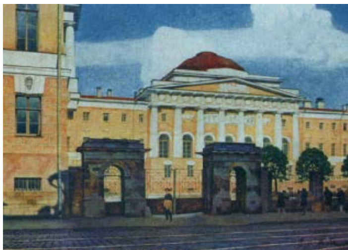
Московский государственный университет