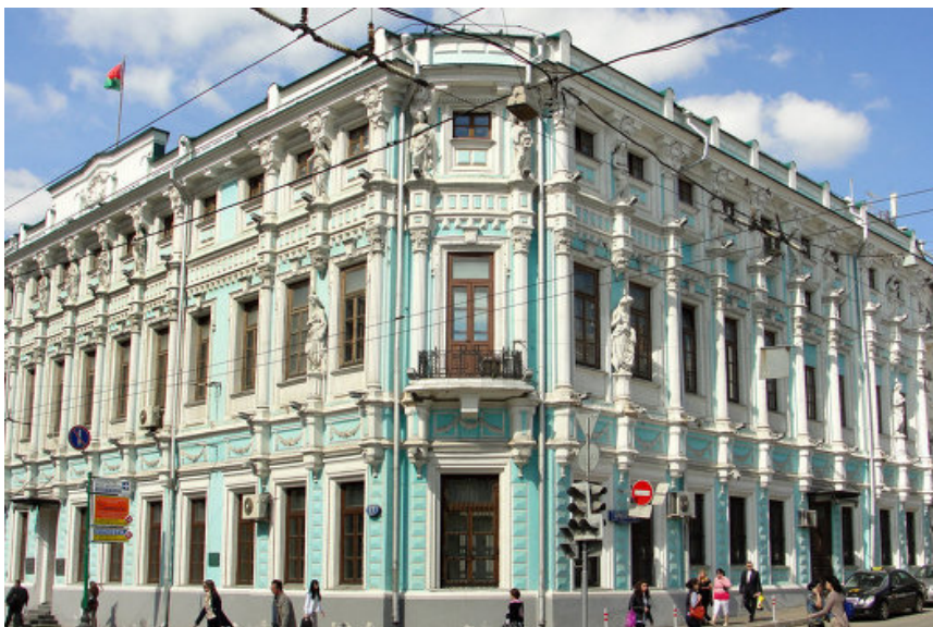
Здание посольства республики Беларусь в Москве