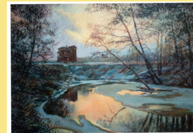
СИНИЕ СУМЕРКИ, ДОМ ОДИНОКО СТОИТ, СКОРО ПОЯВИТСЯ ЗВЕЗДЫ. (Поэзия, акрил, 40x60, 2016 г.)