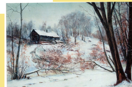
МЯГКО ЗЕМЛЮ ПОКРЫЛ ПЕРВЫЙ СНЕГ, ВОЗДУХ ЧИСТ И ПРОЗРАЧЕН! (Картон, акрил, 40x60, 2016 г.)