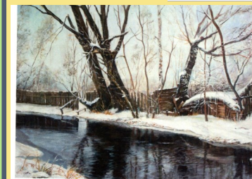
УСТАЛО ВЕТЛЫ НАКРЕНИЛИСЬ, В РЕКЕ ТЕКУЧЕЙ СИНЕВОЙ СИЯЕТ ОПРОКИНУТОЕ НЕБО (Картон, акрил, 40x60, 2016 г.)