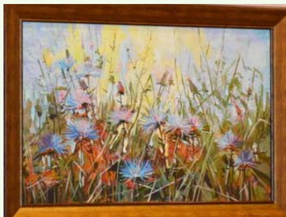
Картины художника Павла Пителина