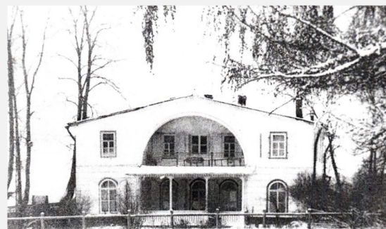
Дом, где жила семья до 1917 года.