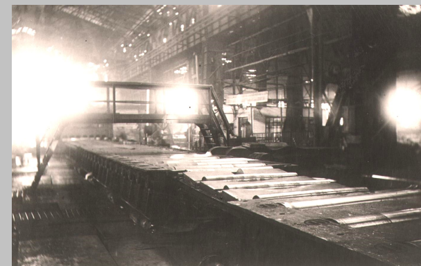
Листопрокатный цех, рольганги от стана к ножницам