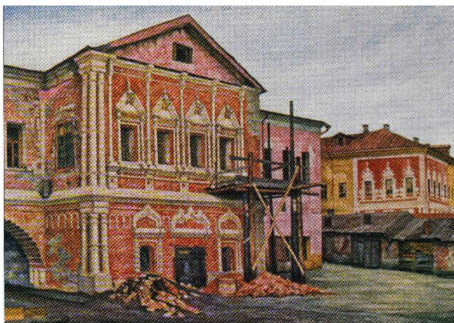
Палаты В.В. Голицына в Охотном ряду