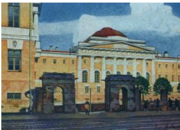
Московский государственный университет