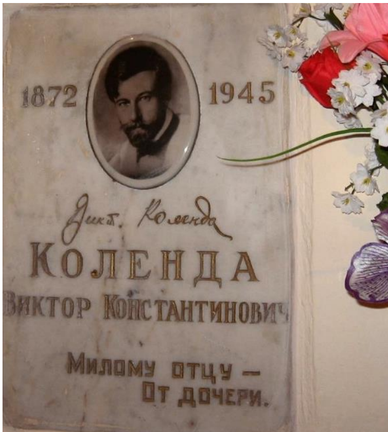
Надгробная плита в Донском монастыре