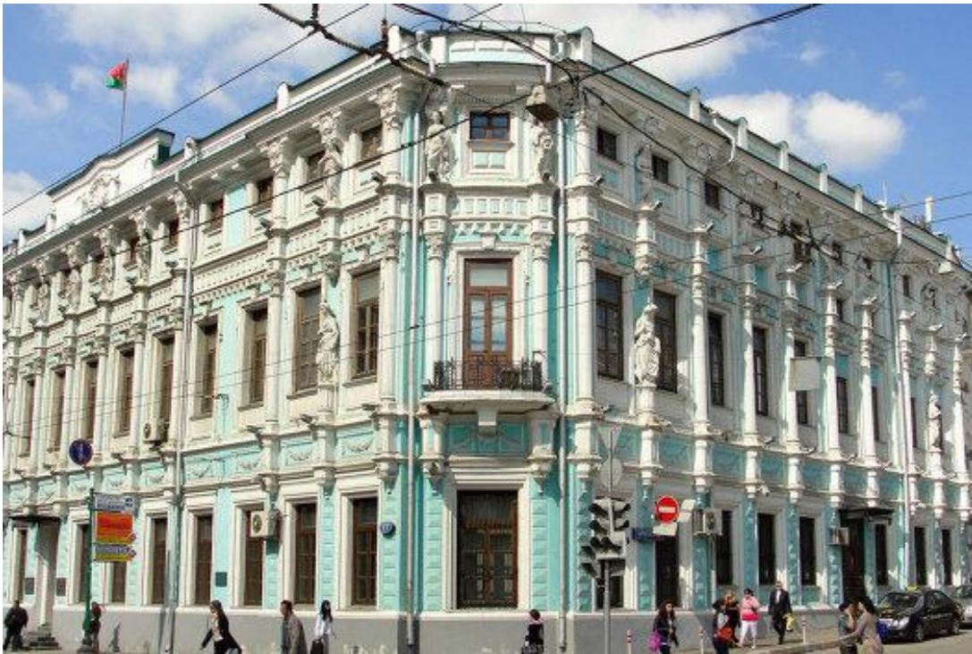
Здание посольства республики Беларусь в Москве