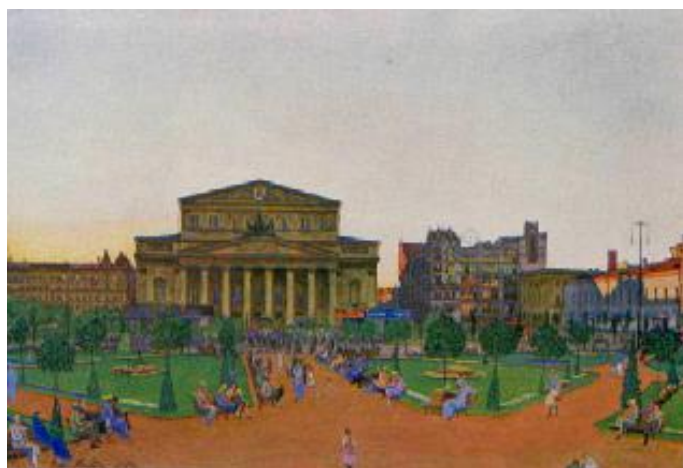
Площадь Свердлова (бывшая Театральная)

В 20-х годах нашего столетия в Сухаревой башне разместился Московский коммунальный музей, положивший начало Музею истории и реконструкции Москвы. Стены музея, располагавшегося сначала в доме №3 по Театральному проезду, а с 1926 года - в Сухаревой башне, украсили акварели Коленды. На них были запечатлены не только памятники архитектуры, но и московские новостройки.