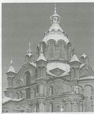
Успенский собор в Хельсинки