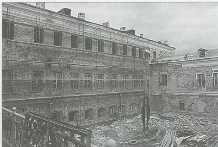
Работы по реставрации «Большого дома», 2007 г.

Полагают, что архитектором его был крепостной зодчий Кисельников. Время строительства — 70-е годы XVIII века. В дальнейшем дом подвергался неоднократным перестройкам и переделкам. Был надстроен третий этаж, так как первоначально дом был двухэтажным. Позже, в 40-х годах XIX века, по свидетельству капельмейстера П. Я. Афанасьева, И. Д. Шепелев «...пристроил к нему обширный каменный флигель. Внутренность этого помещения была крайне оригинальна: окна из разноцветных стекол, вследствие чего в комнатах царил таинственный полусвет: вся мебель в восточном вкусе — полное отсутствие стульев, а только турецкие диваны, покрытые коврами: в некоторых комнатах устроены были потайные лестницы в нижний этаж». Флигель служил местом интимных встреч помещика И. Д. Шепелева