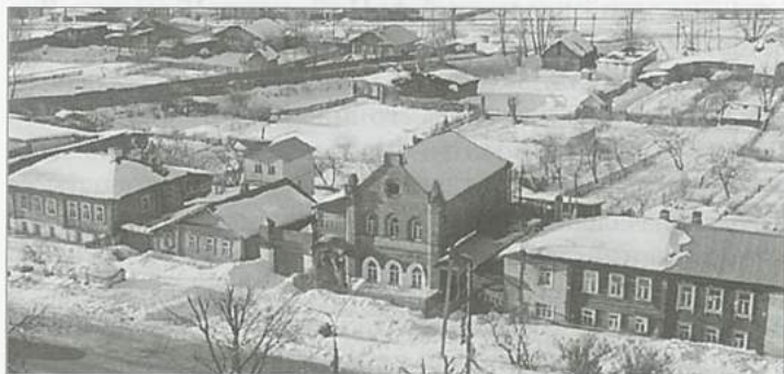
Вид на Скотный

СКОТНЫЙ. Таким топонимом обозначают выксунцы юго-восточный район г. Выксы, расположенный за Верхневыксунским прудом. Сегодня этот топоним непонятен, но если мы вскроем исторические корни его происхождения, то все станет на свое место. Краевед А. Ф. Зыкин в упоминавшихся уже записках пишет о предыстории возникновения топонима «Скотный» так: