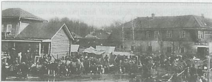
Гусарское поле. Фото конца XIX — начала XX веков

К этому событию можно применить стихи неизвестного мне поэта.