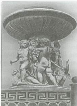
Фонтан на Театральной площади. Скульптор И. П. Витали. Чугун. Литье Выксунских заводов. 1835 г.

ми. За счет опускания водопровода ниже старой галереи и возникновения небольшого напора производительность мытищинского водопровода возросла с 330 000 до 550 000 ведер воды в сутки. В с. Мытищи было построено водоподъемное здание с двумя паровыми машинами, которые, приводя в движение насосы, качали воду в сборный резервуар. От резервуара вода шла по чугунным трубам диаметром 20 дюймов в Москву. В Москве этот водопровод раздваивался на две нитки труб диаметром в 16 дюймов. Одна нитка водопровода шла для наполнения старого резервуара 1829 года, установленного на Сухаревской башне, а вторая подавала воду тоже в Сухаревскую башню, но уже в новоизготовленный, меньших размеров, второй резервуар. Общая длина труб нового мытищинского водопровода составила 44 версты. Чугунные трубы, изготовленные Выксунскими заводами, имели толщину стенок полдюйма у 20-дюймовых труб и пять восьмых дюйма — у 16-дюймовых. Оценивая в общем работы по устройству водопровода, автор проекта А. И. Дельвиг на основе своего опыта давал рекомендации к улучшению вновь строящихся водопроводов: «Хотя водопровод вполне удался, но полагаем лучшим давать стенкам труб диаметром более 12 дюймов толщину до 5/8 дюйма, через что впрочем увеличилось бы количество требуемого на трубы чугуна».