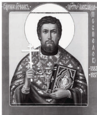
Священномученик Александр Поспелов

XX столетие вошло в историю государства Российского как век гонений на Православную церковь. Век жестокий, кровавый, унесший миллионы неповинных душ. Сколько именно представителей духовенства и мирян пострадали за веру во Христа в годы репрессий советской власти, установить сложно. Претерпев страдания и смерть, они до конца стояли за истину, за Русь Святую. Все они показали нам, что дух непоколебим, что его нельзя уничтожить, что «сила не в силе, а в любви», которая «долготерпит, милосердствует, любовь не завидует, любовь не превозносится, не гордится, не бесчинствует, не ищет своего, не раздражается».