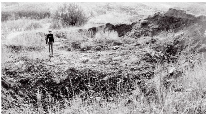
Человек, стоящий на дне котлована

От красавицы Оки на восток, от Выксы через Дивеево и до Первомайска протянулась рудоносная жила, спровоцировавшая появление в середине XVIII века в бескрайних муромских лесах группы чугуноплавильных и железоделательных баташёвских заводов, центром которых стала Выкса. После