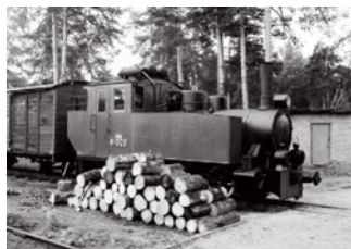
Немецкий паровоз «кукушка»