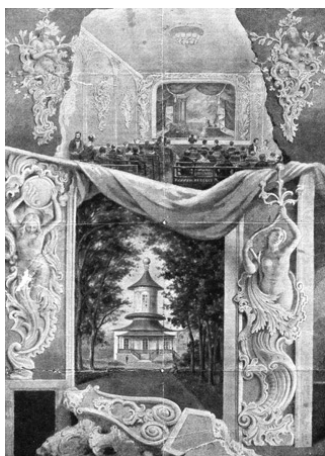
Выксунский театр. Репродукция художника Волкова.

Теперь о первом здании Выксунского театра. На наше счастье, сохранилось его изображение.