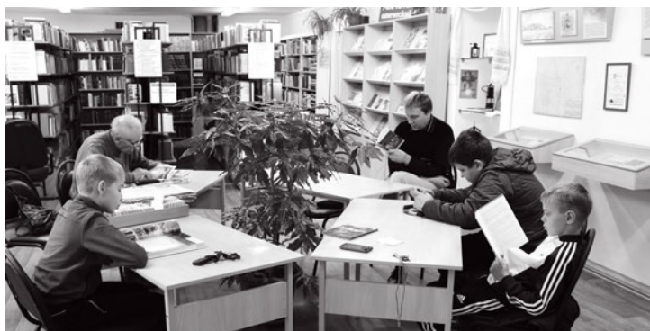
Читатели в одном из залов библиотеки

С внедрением информационных технологий на новый уровень вышла информационная работа библиотеки. Новые возможности в получении информации о крае предоставляет автоматизированная информационно-библиотечная система «Моя библиотека», с помощью которой создается электронная библиографическая база данных «Выкса» (более 11 000 библиографических записей). Пользователи получили доступ к имеющимся библиографическим краеведческим ресурсам в локальном и удалённом режиме. Созданы и постоянно пополняются электронная справочная база данных «Выдающиеся выксунцы» (118 персоналий), фактографическая картотека «Хроника основных событий городского округа»; формируется фонд тематических дозье (135 экз.), которые оцифровываются ввиду их высокой востребованности.