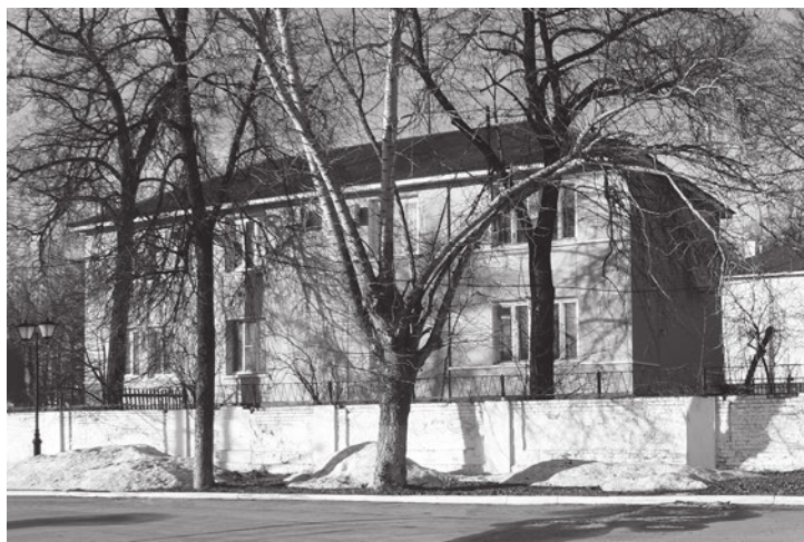
Место, где находился театр при Иване Баташёве

Первое. Большая часть кирпичной стены, огораживающей с фасада этот дом, стоит на фундаменте времен Баташёвых. Что же там было?