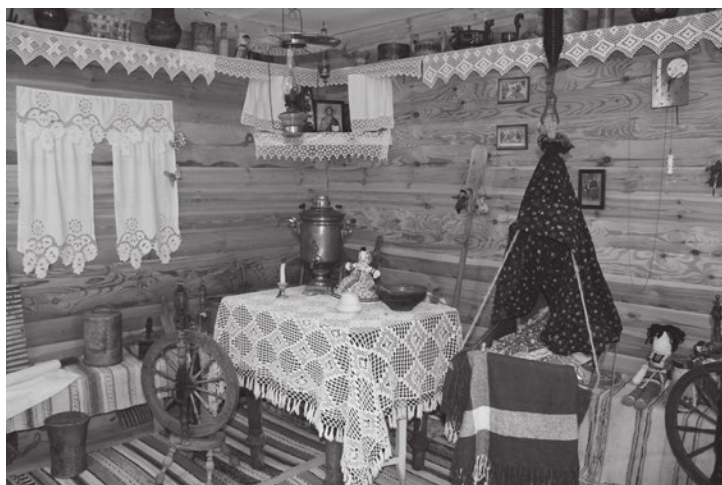
Фрагмент музейной комнаты «Русский дом»

ний. И это прежде всего — встречи с нашими замечательными людьми, знаменитыми земляками, с авторами краеведческих и художественных книг.