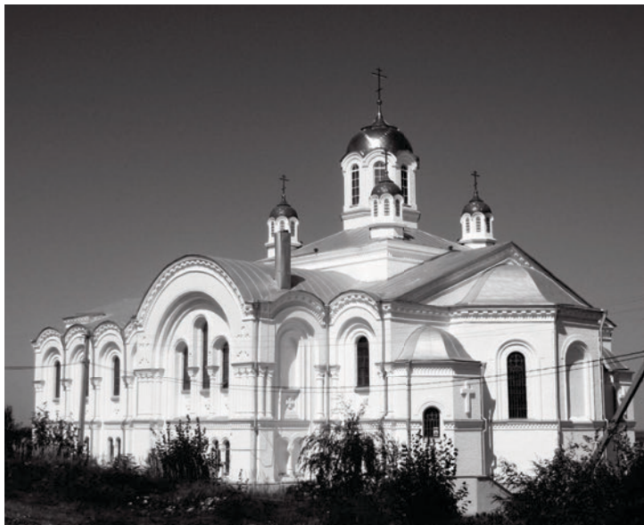
Храм в честь Казанской иконы Божией Матери. Автор проекта — Иван Горностаев

В Волгоградской области, недалеко от городка Серафимович, на берегу Дона, расположился дивной красоты Усть-Медведицкий Спасо-Преображенский монастырь. Главным аргументом посетить его для большинства светских туристов становится «церковь с 33-мя куполами». Храм Преображения Господня действительно поражает воображение. Однако нас туда манил не только он. Но обо всем по порядку.