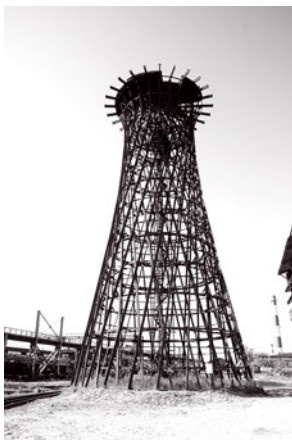
Башня в ныне существующем виде на Нижне-Выксунском заводе

Водонапорная башня мартеновского цеха ВМЗ предназначалась, главным образом, для хранения аварийного запаса химочищенной воды температуры 25 градусов по Цельсию для питания котлов центральной котельной.