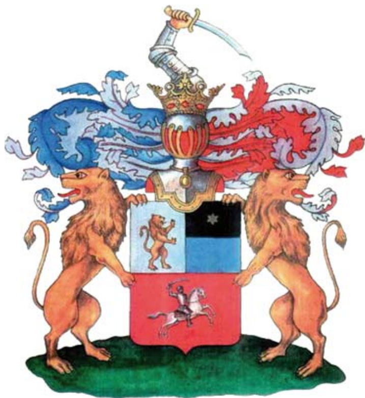
Герб дворян Шепелевых.

Геральдический щит разделен горизонтально на две части. Верхняя часть, в свою очередь, также делится надвое. В правой верхней части на серебряном поле, олицетворяющем правоту и честность, стоит на задних лапах лев «натурального цвета», обращенный в левую сторону, — символ силы, мужества и великодушия. Левая верхняя часть имеет два поля: верхнее черное (скромность, образованность и смирение), с помещенной на нем золотой шестиугольной звездой (премудрость), и нижнее голубого цвета (величие и красота). В нижней части на красном поле (мужество и сила) изображен воин, скачущий на белом коне в левую сторону с поднятым вверх мечом. Щит увенчан турнирным шлемом с дворянской короной с тремя листьями и двумя жемчужинами. Над короной возвышается рука с мечом, свидетельствующая о принадлежности владельцев к военному сословию. Держат щит два льва с загнутыми хвостами. Намет (цветные украшения, образующие фон герба) с правой стороны щита серебряный с голубым, а с левой – красный с серебряным.