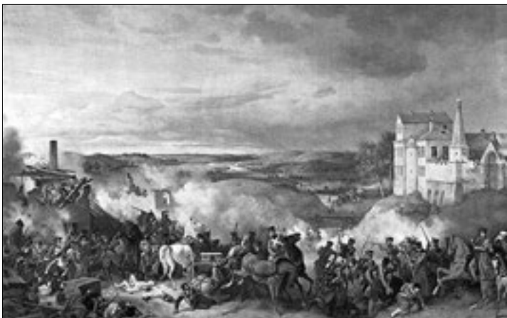
Бой под Малоярославцем. Худ. П. Гессе

ярославце (12 октября), Красном (4–6 ноября), а также при преследовании французской армии до реки Березины (14–17 ноября).