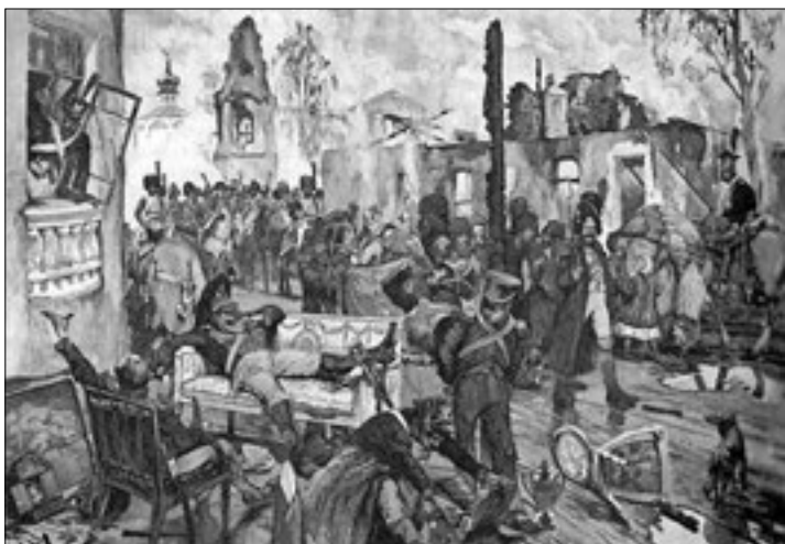
Москва в сентябре 1812 года. Худ. Д. Кардовский

голос участника такого же события, которое состоялось час спустя в другом месте. Письмо поражает силою свежих впечатлений. В нем и облик его автора, упрощенный взгляд на которого, как на раба, тупого холопа, никак не верен. Человек этот, безусловно, достаточно образован, сметлив, благороден и совестлив, как все лучшие люди нашего отечества. Его письмо — еще и искренний документ быта русских дворовых людей: