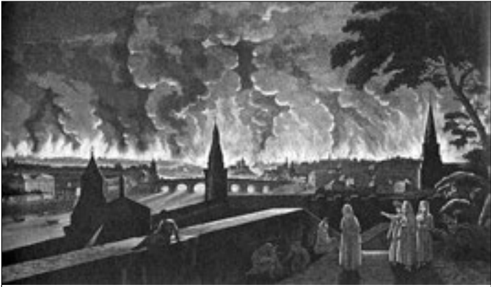
Пожар Москвы. Худ. И. Жибель (Раскрашенная гравюра)

панского, Бургонского, водки, рейнвейна и белого хлеба, каждый с величайшей угрозой. Всех нас измучили и с ног сбили, так что пришлось бежать и скрыться хотя в воду. <...> Там кричат бабы, что солдаты отняли хлеб, в других покоях солдаты разбивают сундуки и грабят все что ни попало».