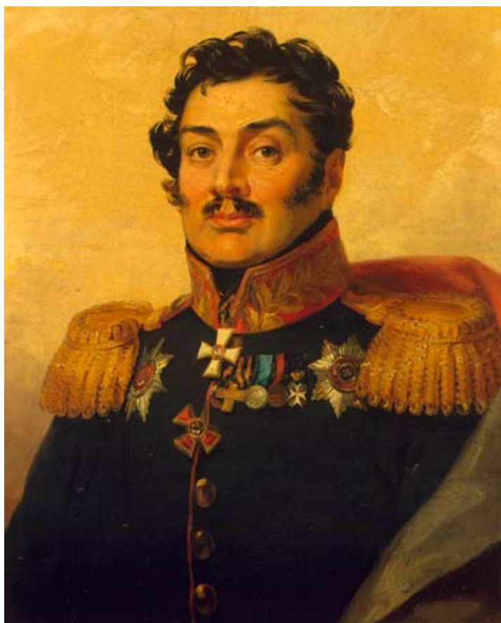
Дж. Доу. Д. Д. Шепелев. Нач. XIX в. (Эрмитаж).