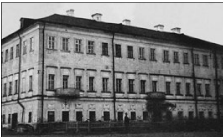
Господский дом в Выксе

стояла из огромного дома в 40 комнат, парка со зверинцем и оранжереями, театра и двух церквей.