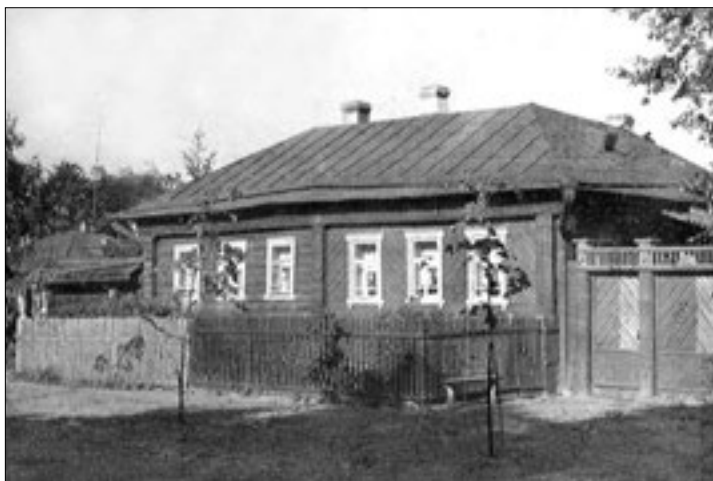
Отчий дом. 1930-е гг.

К осени 1911 года работы на строительстве моста в виде устройства насыпи, кладки мостовых устоев и прокладки железнодорожной ветки на обоих берегах Волги были закончены. Наступила пора монтажа ферм. В связи с этим начался отлив рабочей силы, занятой на строительстве. Бум, вызванный строительством, затихал. Пришёл конец и благоденствию нашего села. Раз разъехались массы рабочих, то, естественно, сократилось количество заказчиков у отца, а его мелкая торговля ситцем и готовым платьем