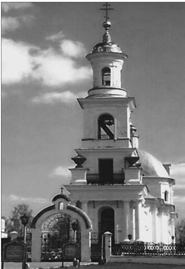
Христо-Рождественская церковь в Выксе

ние (производство паровых двигателей, оборудования для заводов и пароходов).