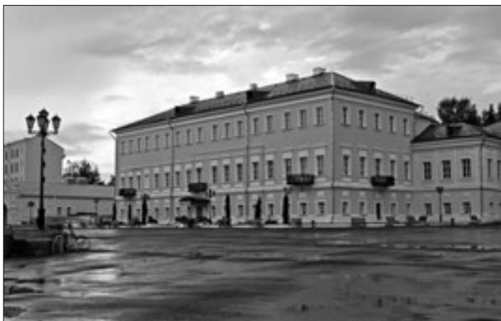
Выкса. Господский дом. 30 июля 2008 г.