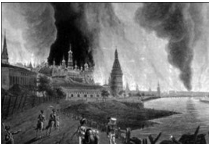
Подпись под иллюстрацией «Пожар Москвы». 1812 г.

ленная, — жаловался Максим барину Ивану Родионовичу. — Покоев много, но постелей набрать было негде, а на холопской постеле спать никто не хотел. <...>