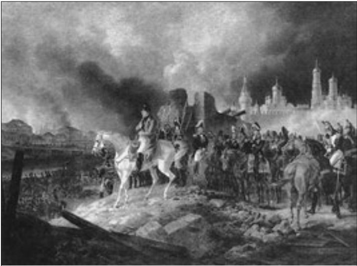
Наполеон в горящей Москве. Худ. А. Адам

целы. Музыкантского флигеля нижний этаж сгорел, а верхний цел. Погреба, конюшни, платные, хлебные и людская кухня сгорели. Под оранжерею осталась цела какими-то судьбами одна только господская кухня с приспешною. <...> Ворота кроме больших железных все сгорели, заборы все сгорели, а потому окружены мы стали полем...»