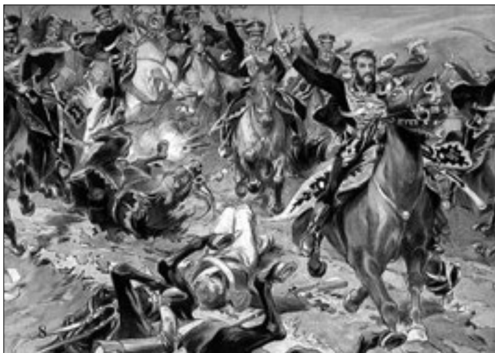
Атака Гродненского гусарского полка. Худ. Н.С. Самокиш

Д.Д. Шепелеву было поручено занять город Або и, при благоприятных условиях, Аландские острова. 13 февраля его отряд выступил к Або в полной неизвестности, с какими силами придется иметь дело. Каково же было удивление гусар, когда вместо ожидаемых пушечных выстрелов авангард русских войск был встречен у ворот Або жителями города и офицером Гродненского полка, идущим впереди них! Как оказалось, он вез донесение из штаба, ошибся в расчетах и прибыл в город задолго до прихода отряда. Офицер не растерялся и сумел расположить к себе местную власть.