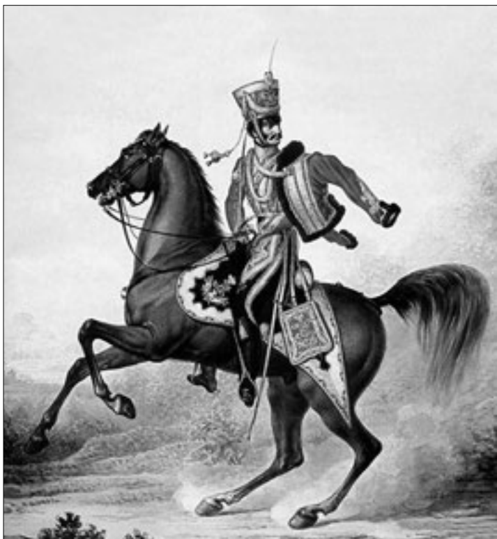
Гусар в парадной форме

правиться через Алле и обойти левое крыло русских войск. С заданием он с успехом справился. А 29 мая состоялось сражение у Гейльсберга, в котором гродненцы продемонстрировали полное бесстрашие перед лицом неприятеля.