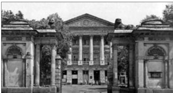
Фасад московского дома близ Яузского моста

щади около трех гектар, была необычайно живописна. Спуски, обрывы, чудесные виды на реки Москву и Яузу, на Кремль. Дворец Баташева оказался главным, если не единственным ориентиром Таганского холма.