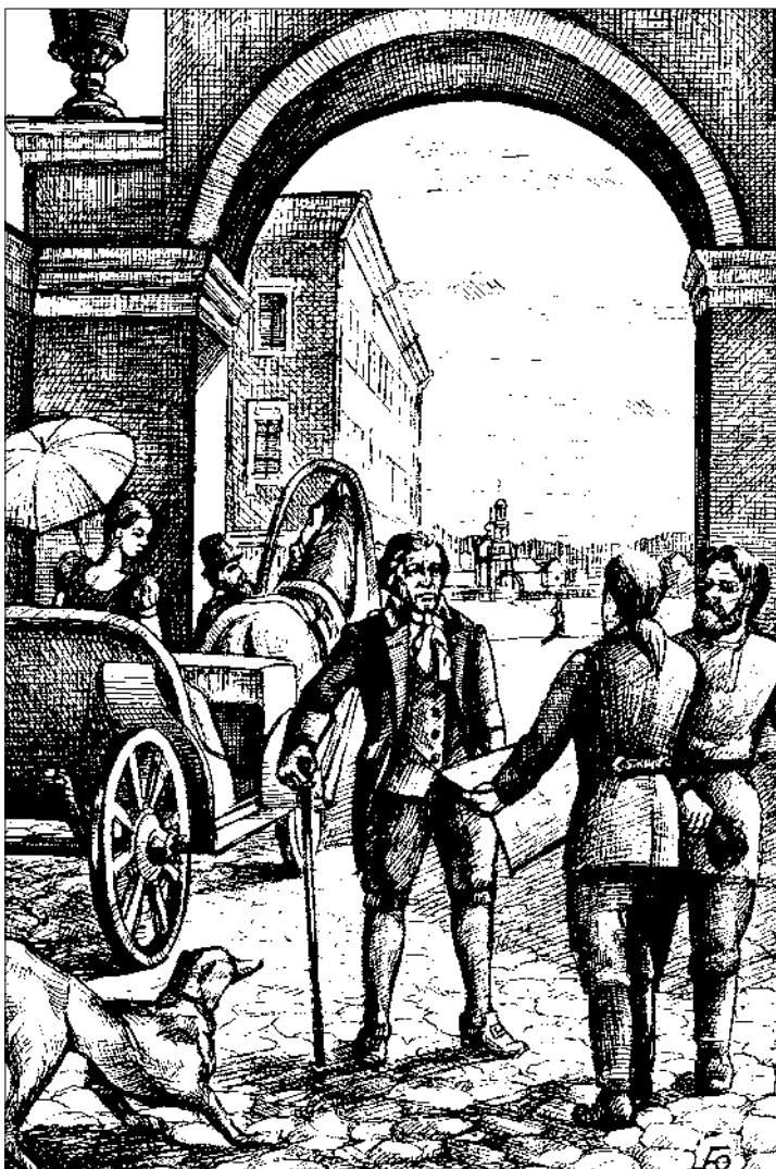
На Выксе. Гравюра. Худ. Ю.В. Гальянов

Дарья Ивановна, ежели судить по её скульптурному портрету, любовно отлитому из дедушкиного чугуна, была барышней в высшей степени миловидной. Она не слыла