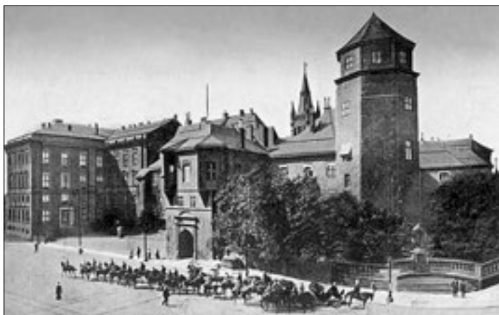
Кенигсберг. Орденский замок

мии генерала от кавалерии графа П.Х. Витгенштейна под командованием генерал-лейтенанта Д.Д. Шепелева остановился на отдых у города Пильшау.