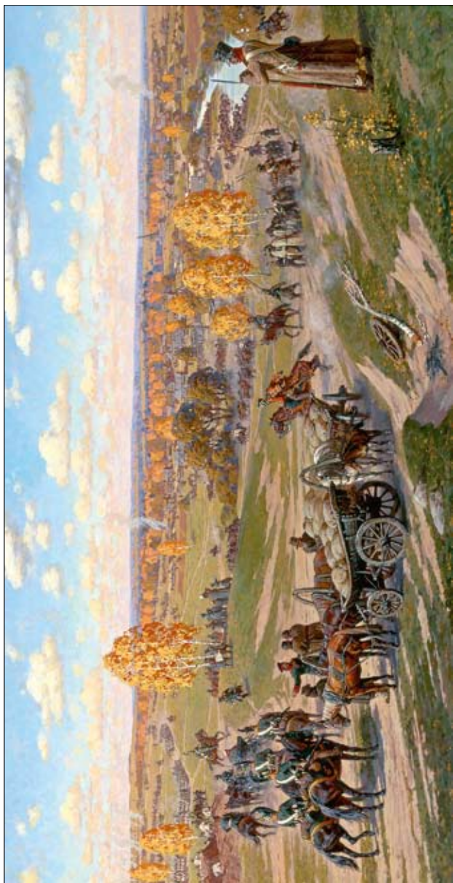
А. Ю. Аверьянов. Тарутино 1812 год