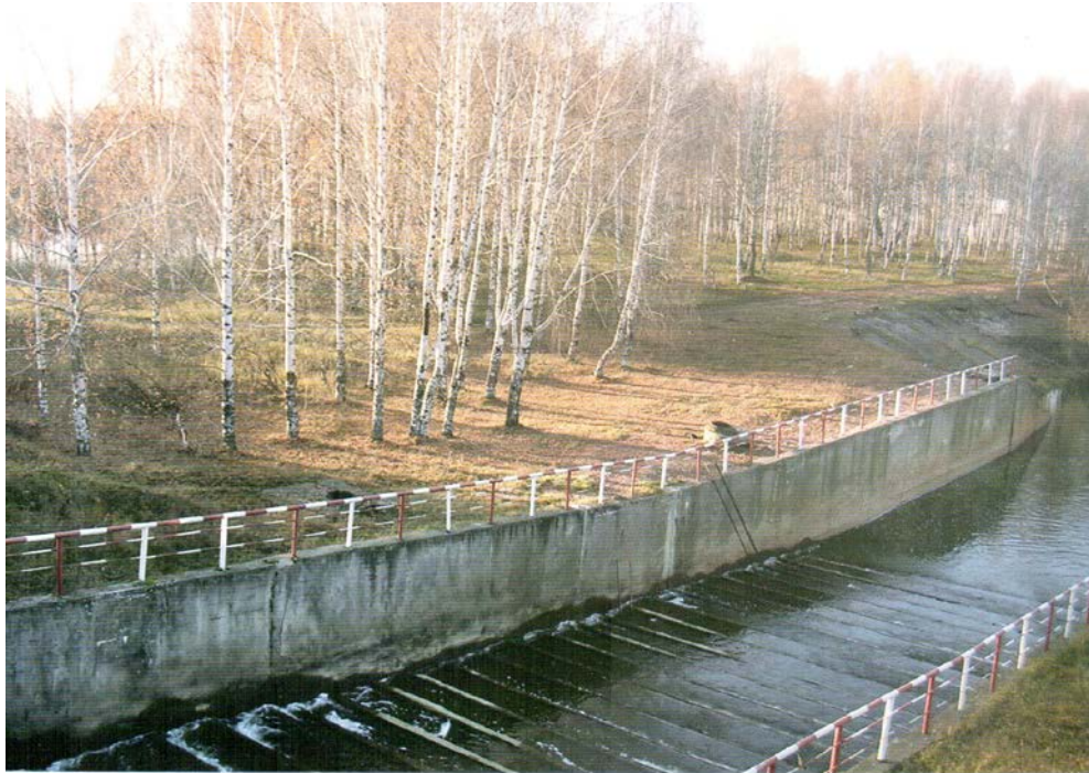
Запасный пруд. Шлюзовые сооружения